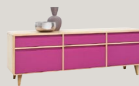
Komoda 3D3S 191 niska 191 / 44 / 66