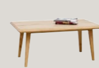
Stolik 120 / 70 / 50