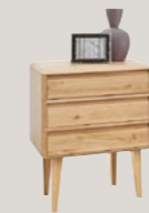
Komoda 3S wysoka 65,6 / 44 / 82