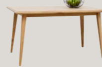
Stół 150-250 / 90 / 75