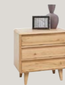
Komoda 3S niska 65,6 / 44 / 66