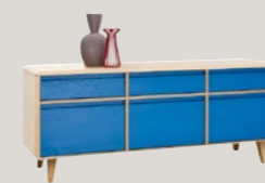
Komoda 3D3S 159 niska 159 / 44 / 66