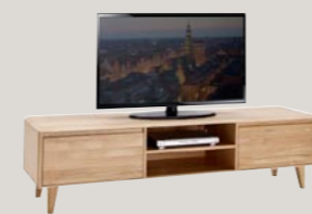
Szafka RTV 2K 191 / 44 / 50