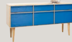
Komoda 3D3S 159 wysoka 159 / 44 / 82