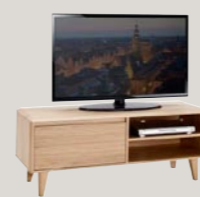
Szafka RTV 1K 128 / 44 / 50