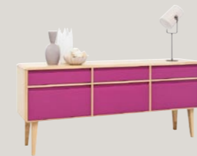
Komoda 3D3S 191 wysoka 191 / 44 / 82