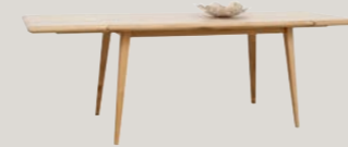
Stół z dostawkami