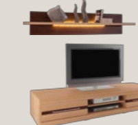
Szafka RTV 2S z wnęką 190 / 50 / 35