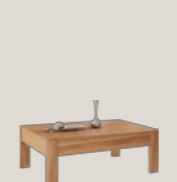
Stolik z podnoszonym blatem i szufladą 120 / 70 / 45