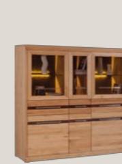
Komoda wysoka 6D3S 161 / 43 / 158