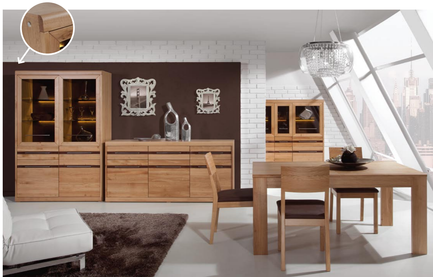
Perfekcyjnie wykonane meble w kolorze naturalnego dębu muśniętego czekoladą wypełnią wnętrze ciepłym i magicznym klimatem.