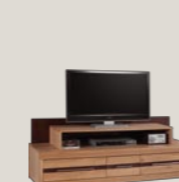
Nadstawka RTV 156 / 38 / 25 190 / 38 / 25