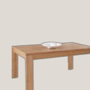
Stół 160-210 / 90 / 75