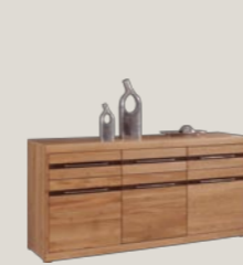
Komoda 3D3S 186 / 46 / 90