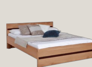
Łóżko 166 / 207 / 76,5