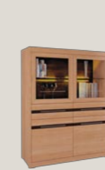
Komoda 4D2S 126 / 43 / 158