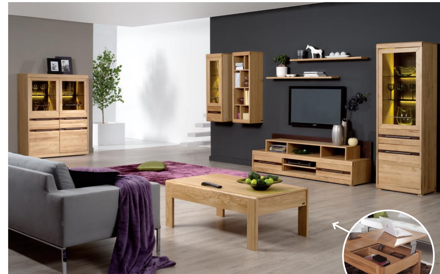
Kolekcję Volare wyróżniają zaokrąglone krawędzie, które nadają meblom łagodniejszej linii.

KOLEKCJA MEBLI VOLARE TO WYKORZYSTANIE NOWOCZESNEGO TRENDU W MEBLARSTWIE. MINIMALIZM BĘDĄCY PODSTAWĄ KOLEKCJI, ZOSTAŁ WZBOGACONY O SZCZEGÓŁY, KTÓRE PRZYCIĄGAJĄ WZROK I ŚWIADCZĄ O WYSMAKOWANYM WZORNICTWIE MEBLI. ARANŻACJA WNĘTRZA MEBLAMI Z KOLEKCJI VOLARE WPROWADZI UŻYTKOWNIKA DO NOWEGO WYMIARU PRZESTRZENI. POZIOME ŻŁOBNIENIA W KOLORZE GORZKIEJ CZEKOLADY NADAJĄ MEBLOM WYJĄTKOWEGO CHARAKTERU A UMOCOWANE W NICH UCHWYTY SĄ PRAWIE NIWIDOCZNE, JEDYNIĘ DAJĄ O SOBIE ZNAĆ LŚNIENIEM METALU. WYBARWIENIE GORZKIEJ CZEKOLADY MA SWOJĄ KONTYNUACJĘ NA SZCZOTKOWANYCH ŚCIANACH TYLNYCH PRZESZKOLONÝCH POWIERZCHNI, PODKRĘŚLONYCH PRZEZ SUBTELNE OŚWIETLENIE I PRZYCIEMNIONE SZKŁO ANTISOL.