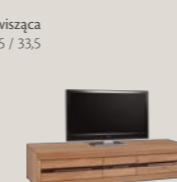
Szafka RTV 3S 161 / 50 / 35